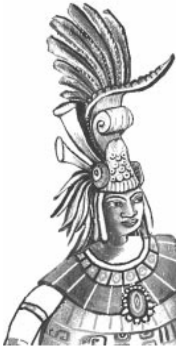
Basada en la leyenda maya de la princesa Sac-Nicté y Canek, señor de los itzaes.

INSTRUCTIONS: Read the following passage carefully and answer all parts of questions 1 to 4 in Spanish . Your answers must be based on the passage. Complete sentences are not required.