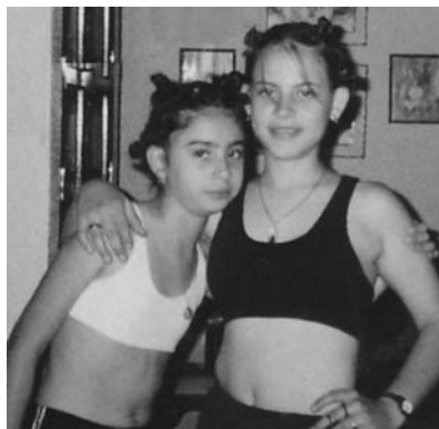
¡Listas para el ejercicio!

Los capitalinos somos 7 activos y aventados. A todos nos 8 ir sobre todo al cine o al centro. Pero en esta época 9 calor todo el día y por las noches suele 1 llover. Aun así vamos al parque Aurora o a comernos todos juntos un rico helado.