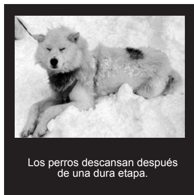
Los perros descansan después de una dura etapa.