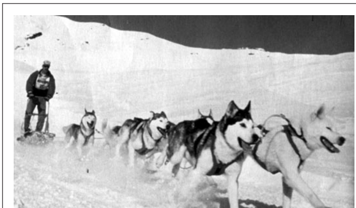
Cada trineo va tirado por doce perros.

Los perros se entrenan diariamente, en invierno sobre nieve y en verano con un triciclo especial. En verano, los entrenamientos son más relajados, pero a partir del otoño empiezan los entrenamientos en serio. Los primeros días corren de 10 a 15 kilómetros, hasta que consiguen llegar a los 35 kilómetros. La alimentación también es muy importante. Tienen una dieta equilibrada y toman suplementos vitamínicos, como cualquier deportista de élite.