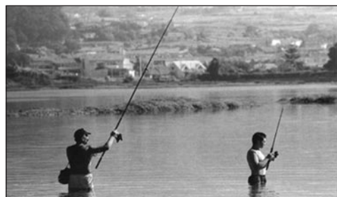
La bahía interior.