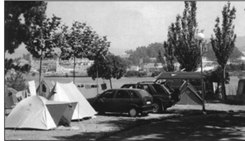
Zona de Camping.

Y como complemento a todo ello, pase unos momentos inolvidables en compañía de su familia disfrutando de la magnífica piscina que ponemos a su disposición, así como del «GRAN TOBOGÁN ACUÁTICO», que hará las delicias de mayores y pequeños.