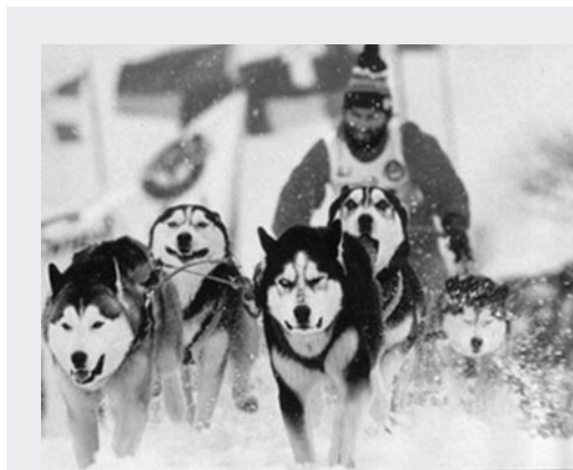
En este deporte los protagonistas son los perros.

En este deporte los protagonistas son los perros. Cada trineo va tirado por doce perros, pero el éxito de la carrera depende del perro-guía, generalmente de raza husky , ya que son más rápidos.